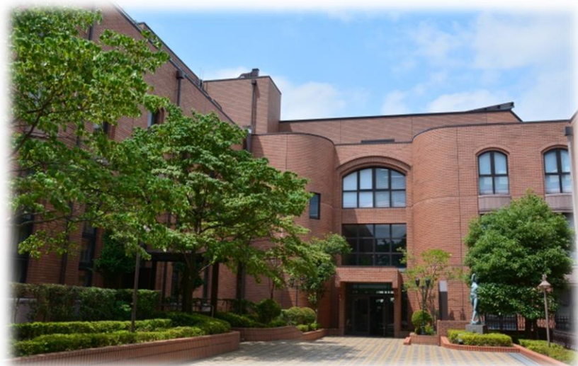
愛国学園短期大学 事務局 TEL.03-5668-7260